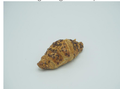
Afbeelding 2: Gebakken product