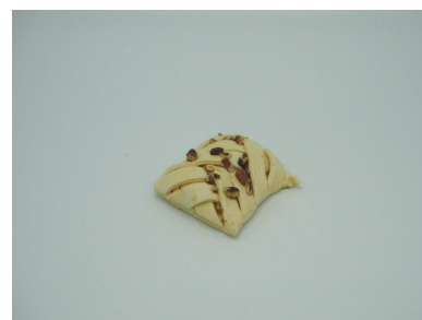
Imagen 1: Producto sin hornear

Las fotos son solo indicativas, es posible una ligera desviación de la realidad.