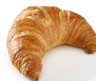
Εικόνα 2: Ψημένο προϊόν